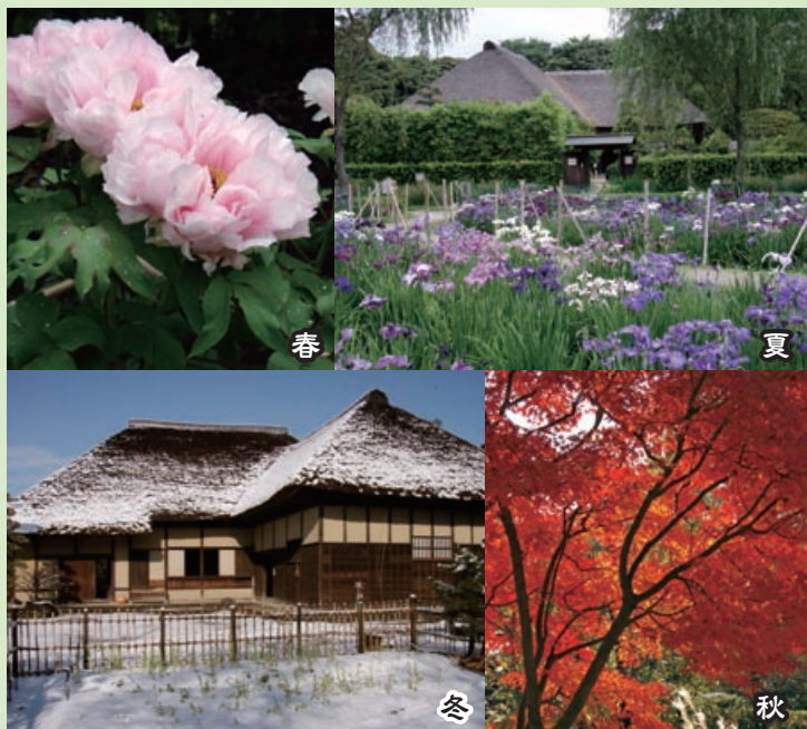
旧鶺田家住宅の四季