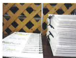
左の書類を点訳すると右の分量になります。