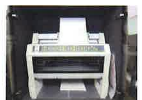
点字用のプリンター