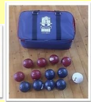
パラスポーツ器具の貸し出もしています

この他にも、県立千葉盲学校（視覚障がい）、県立千葉聾学校（聴覚障がい）、県立八千代特別支援学校（知的障がい：小中高等部）県立船橋夏見特別支援学校（肢体不自由：中学部、高等部）等の特別支援学校があります。