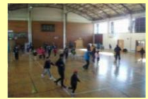
就学前の友だちとの交流