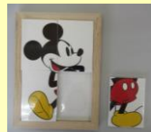
一人ひとりに合わせた教材教具