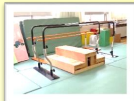
自立活動室では身体の動きを高める運動をしています

また、ICT教育の推進や障がい者スポーツ教育の充実にも力を入れており、今年度は、「心のバリアフリー教育地域拠点校」として、車いすバスケット体験やパラスポーツでの交流に取り組んでいます。