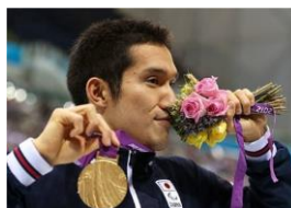
ロンドン五輪での金メダル

競泳選手としての一線からは退きましたが、ライフワークである「泳ぐこと」は継続中。選手時代から職業訓練を受けていたあかね園に通い、新たな人生の目標に向けて飛び込んだところです。