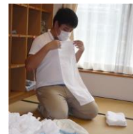
施設で働く様子 (H27年12月号掲載)