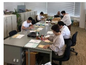
事務仕事を行う障がい者の方々

国が定める障害者雇用率(法定雇用率)は2.2%のため、常勤従業員が100人の企業は、障がいのある人を2人以上雇用する必要があります。