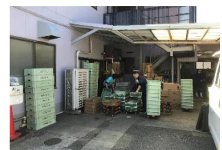
けいようランチ外観

特別支援学校では、主に高等部1年生の実習をお願いしています。実習が初めての生徒も多いのですが、温かいご指導は生徒の進路を考えるにあたり貴重な財産となっています。(取材:椿)