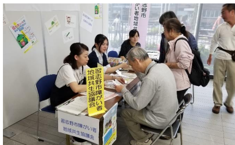
福祉ふれあいまつりで無料配布

当日はブースに来てくれた方々に、自らカードを選んでもらい、ラミネートをした上でリングで留め、オリジナルのコミュニケーションカードを作ってもらいました。