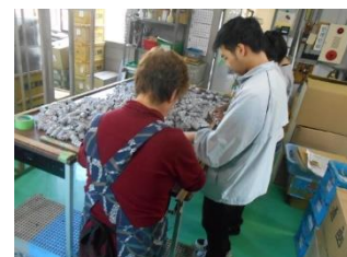
部品を並べる実習生と社員の方

取材当日は、障がい福祉施設に通う知的障がいのある方が実習をされていました。実習では、社員さんと一緒に繰り返しの単純作業である部品の取付けに黙々と取り組まれていました。(取材:武井)