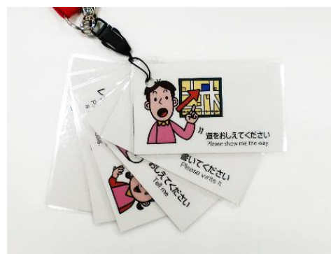
コミュニケーションカード

昨年10月27日（土）の「習志野市福祉ふれあいまつり」において、カードを皆さんに知ってもらい利用していただくことと障がいのあるなしにかかわらず、お互いを、よりわかり合うことを目的にブースを出しました。