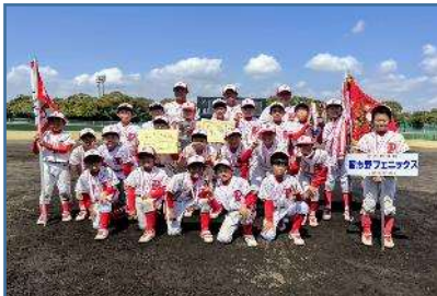
優勝：習志野フェニックス

3月20日～22日・28日に、第30回少年野球新人大会（兼）第46回習志野市スポーツ少年団軟式野球大会が開催されました。この大会は新6年生にとっての最初の公式市内大会となります。激戦を勝ち抜き、見事優勝を果たした習志野フェニックスは、第46回全日本学童軟式野球大会千葉県予選大会に出場。準優勝の実籾・袖ヶ浦連合と第3位の鷺沼マリーンズは、第48回千葉県スポーツ少年団軟式野球交流大会に出場することとなります。