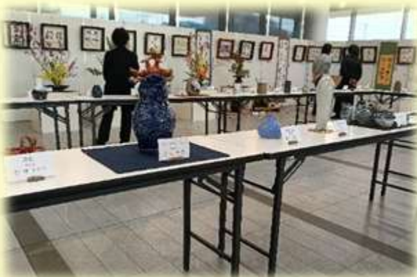
(市庁舎展示の様子)