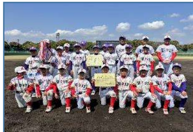
準優勝：実籾・袖ヶ浦連合