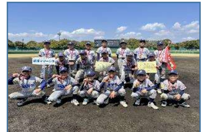
第3位：鷺沼マリーンズ