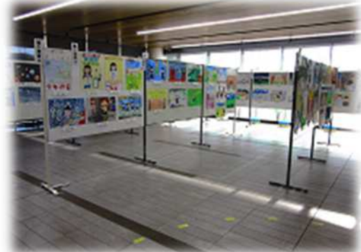
▲ 青少年健全育成標語展 「少年の日」ポスター展