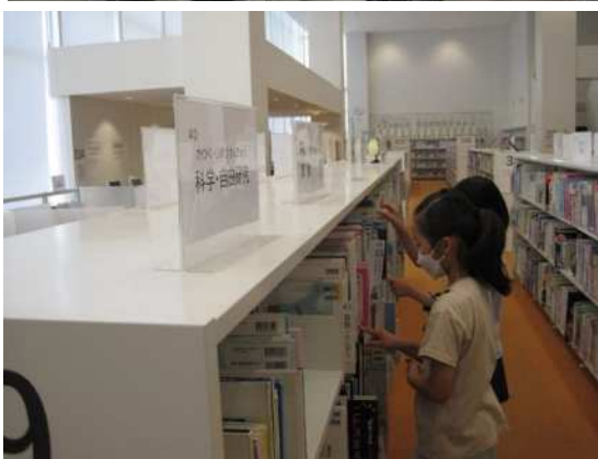
▲ 子ども1日図書館員(中央図書館)