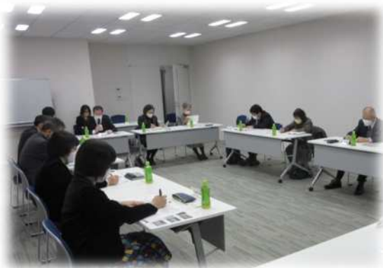
▲ 青少年センター運営協議会