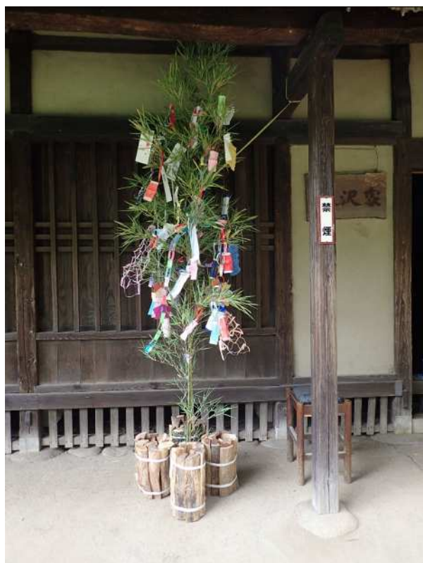
▲ 旧大沢家住宅 七夕飾り