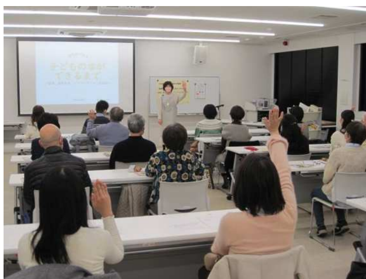
▲ 編集者が語る子どもの本ができるまで(中央図書館)