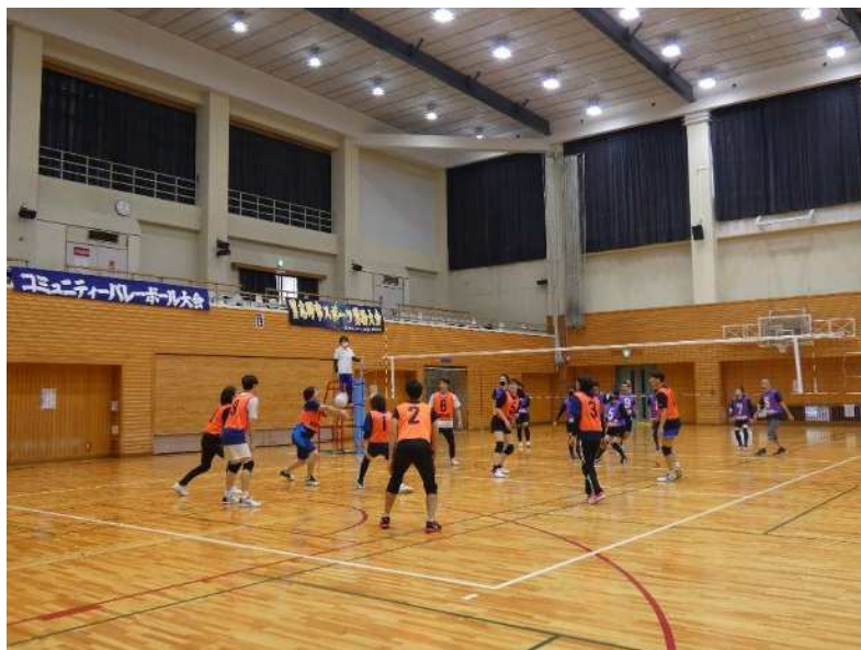
▲ コミュニティバレーボール大会(生涯スポーツ課)