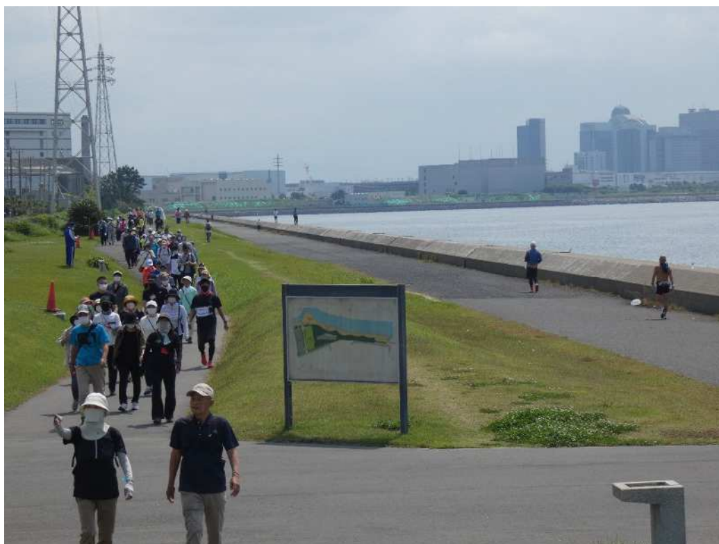
▲オール習志野歩け歩け大会(生涯スポーツ課)