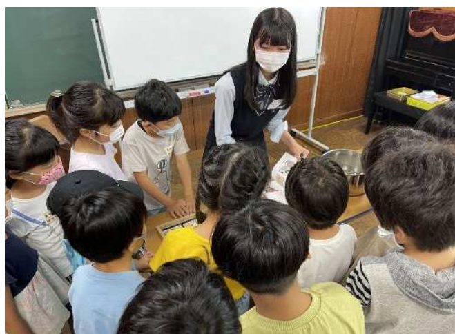
袖ヶ浦公民館 ▶ 子ども講座 「君も化石博士!化石のレプリカを作ろう」