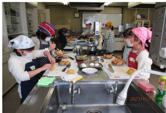
谷津公民館 子ども講座「ちばのめぐみで、 まんてん笑顔弁当をつくろう!」 ▶