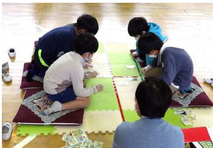
◀ 実花公民館 子ども講座「実花かるた会」