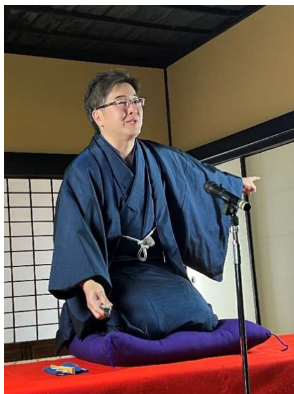
▲ 旧鴫田家住宅 落語会