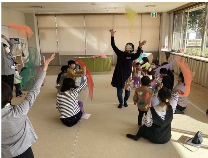
▲ 親と子のわらべうた(谷津図書館)