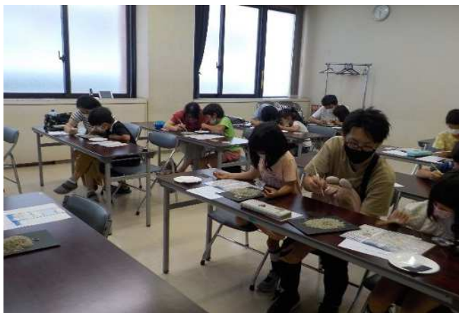
◀ 新習志野公民館 子ども講座「海のようにせいをさがそう」