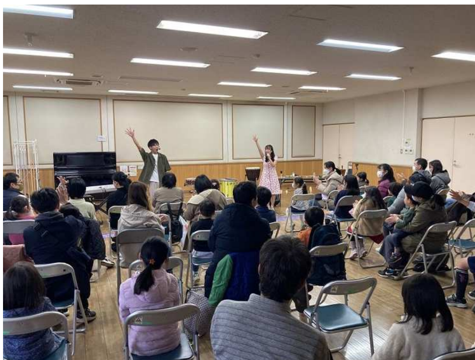
▲ パーカッションファミリーコンサート (谷津図書館)