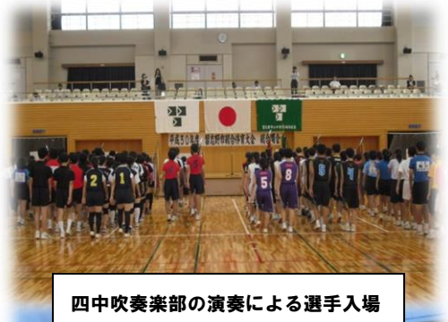
四中吹奏楽部の演奏による選手入場