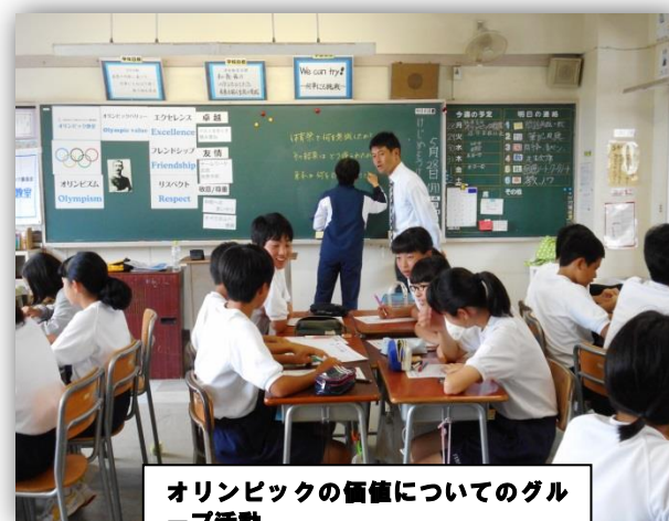
オリンピックの価値についてのグル ープ活動