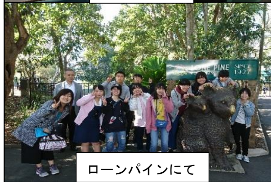
ローンパインにて

編集後記 今年の夏は記録的な猛暑となっております。熱中症や夏バテなど体調を崩している方はいないでしょうか。夏の疲れが出やすいころですので、ご無理をなさないう、皆さんくれぐれもご自愛ください。