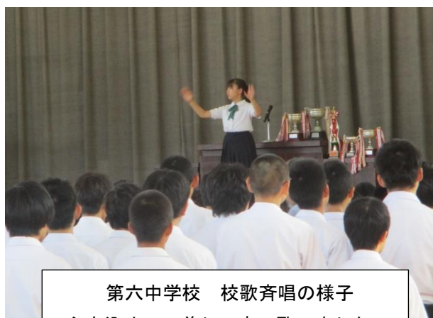
第六中学校 校歌斉唱の様子 心を込めて、美しい声で歌いました。