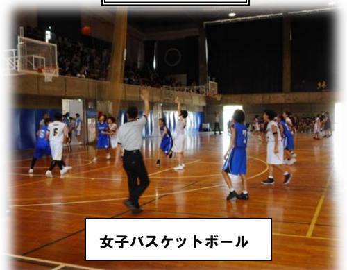
女子バスケットボール