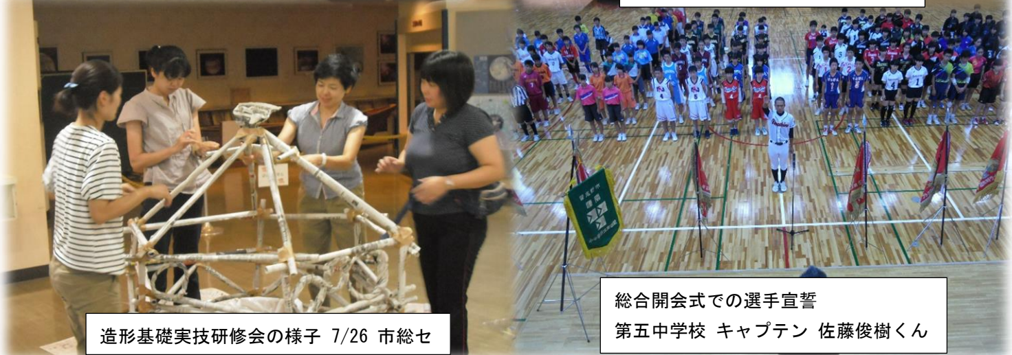
造形基礎実技研修会の様子 7/26 市総セ