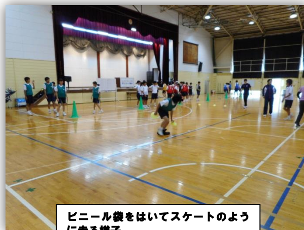
ビニール袋をはいてスケートのよう に走る様子

習志野市では他に、秋津小学校、香澄小学校、第七中学校がオリンピック・パラリンピック教育推進校として千葉県から指定を受けています。