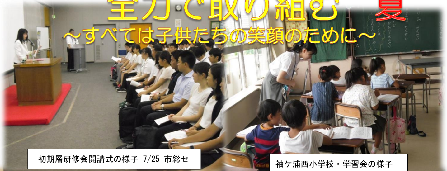
初期層研修会開講式の様子 7/25 市総セ