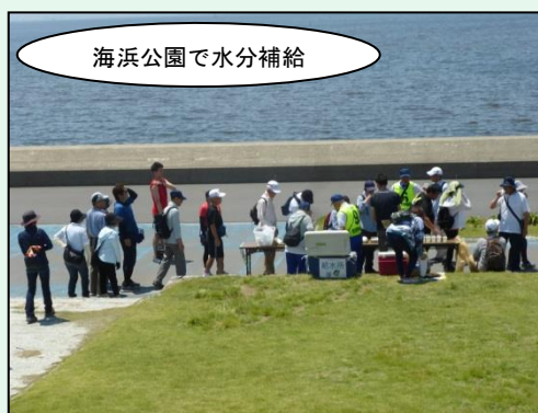
海浜公園で水分補給