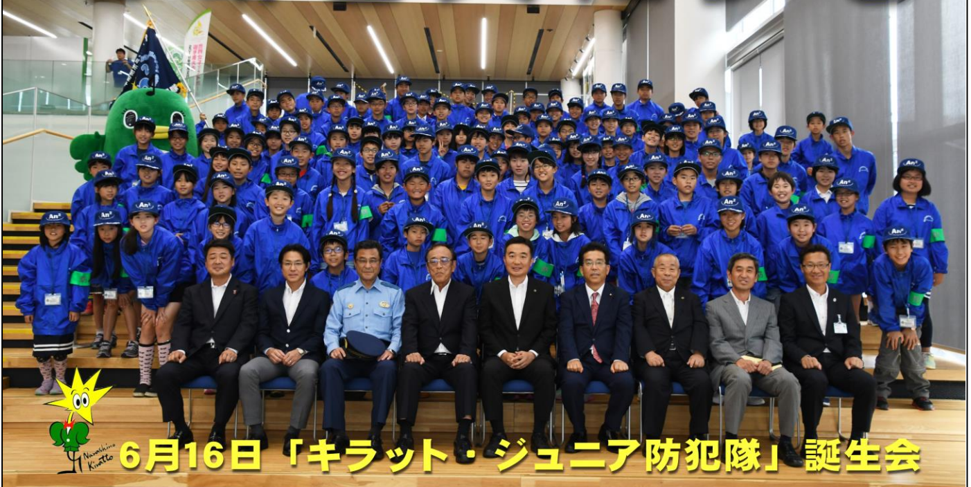
6月16日「キラット・ジュニア防犯隊」誕生会