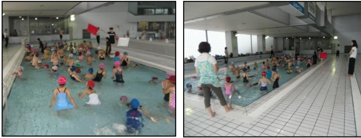
ボランティアに支えられ 国際水泳場で泳ぎを練習する谷津っ子たち