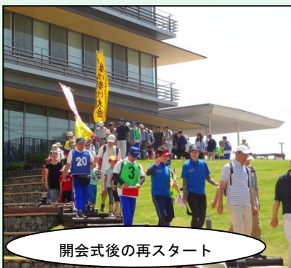
開会式後の再スタート