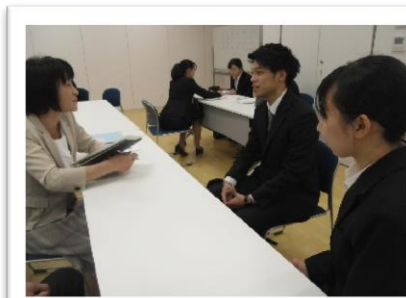
教頭先生との初打ち合わせ