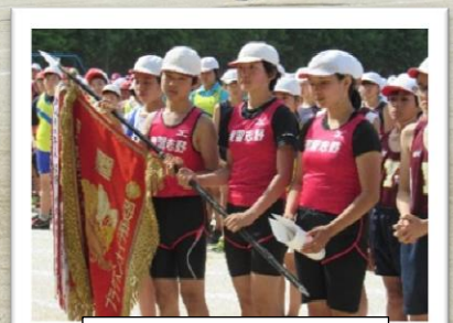
総合優勝おめでとう！

5月16日(水)、実花小学校に市立全小学校の代表児童が集まり、陸上大会が行われました。