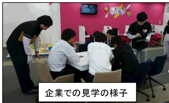
企業での見学の様子

学校(大学、短期大学、専門学校)・企業・役所等を見学することで、進路に対する意識を高め、見学して得た情報を今後の進路決定の判断材料にします。