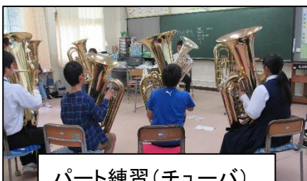
パート練習(チューバ)

開講式の後には早速第1回のパート別練習がありました。自己紹介に始まり、習高生が姿勢や息の出し方などの基本を熱心に教えている姿が印象的でした。