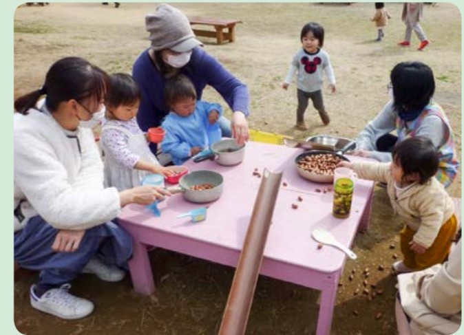
各こどもセンターの詳細は