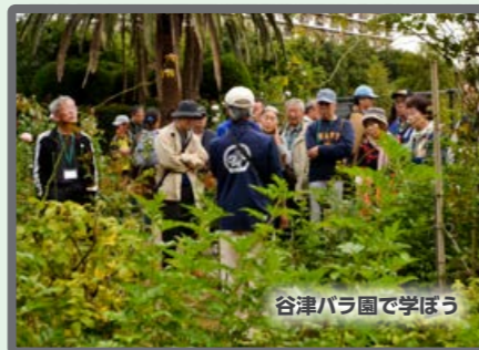
谷津バラ園で学ぼう