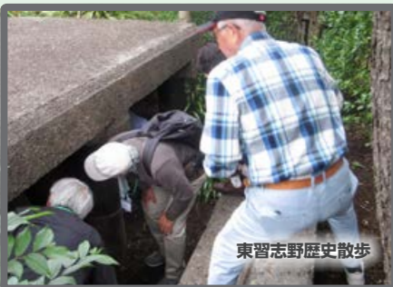
東習志野歴史散歩