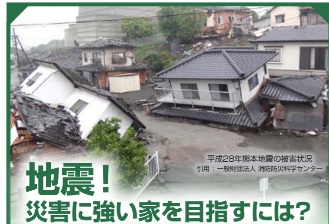
平成28年熊本地震の被害状況