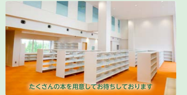
たくさん本を用意してお待ちしております