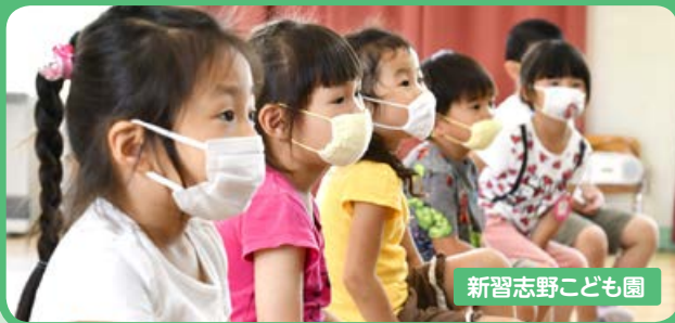
新習志野こども園