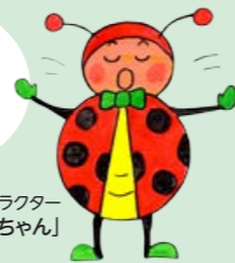
てんとうむし体操イメージキャラクター「てんてんちゃん」