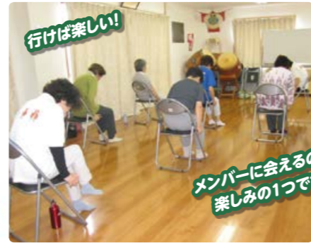
メンバーに会えるのも 楽しみの一つです