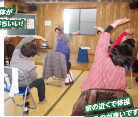
家の近くで体操 できるのが良いです