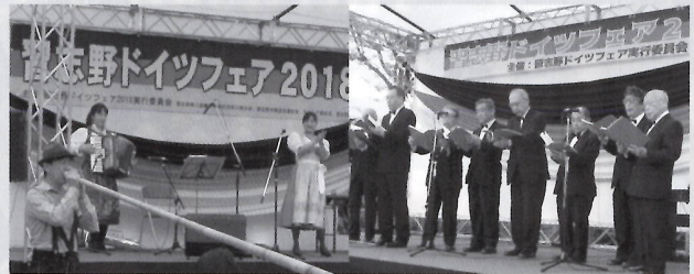
・アルプス音楽団