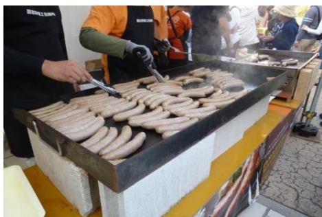
ご当地グルメ「習志野ソーセージ」

本場ドイツの雰囲気、習志野でお楽しみください。皆様のご来場をお待ちしております。