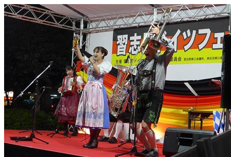
ステージイベント「アルプス音楽団」