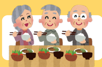
バランスのよい食生活