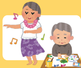
日々の生活を楽しむ