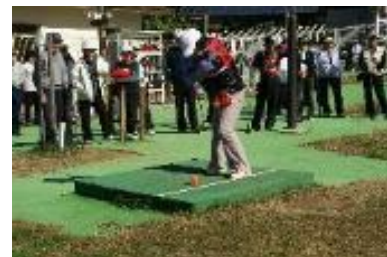
(パークゴルフ大会)