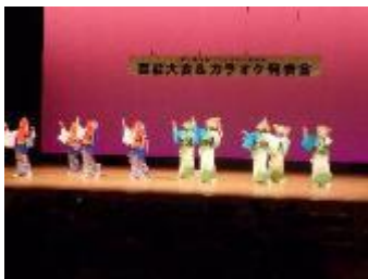
(芸能大会・カラオケ発表会)