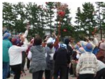
(高齢者スポーツ大会)