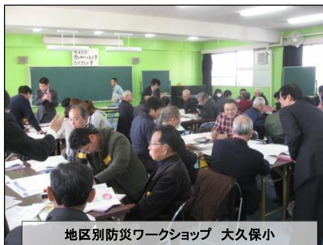
地区別防災ワークショップ 大久保小