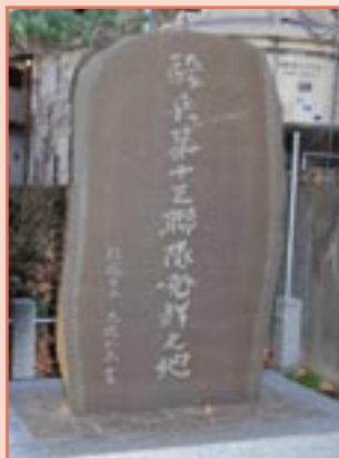
旧騎兵第13連隊記念碑