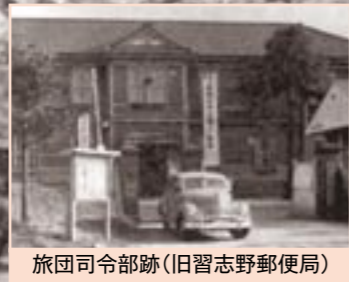
旅団司令部跡(旧習志野郵便局)