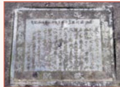
旧騎兵第14連隊記念碑