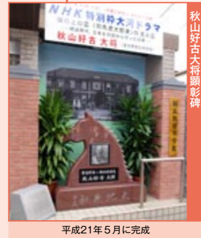
秋山好古大将顕彰碑