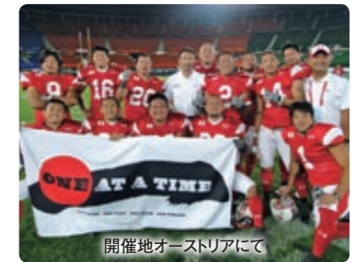
開催地オーストラリアにて