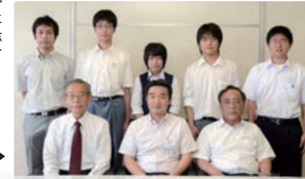
平成23年度 市民代表団 ▶