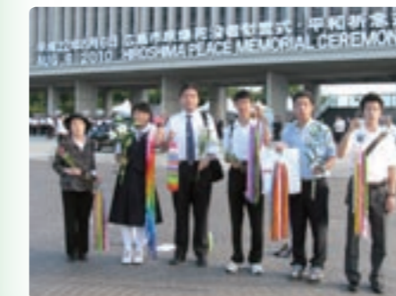
平成22年度市民代表団

きっと、戦争を実際に知らない僕たちが原爆の恐ろしさを100%正確に理解することはできません。でも、100%に近づくことはできるはず。100%に近づかなければいけない。今回の派遣を通して携わった人の中で、自らの経験を話している途中で言葉に詰まってしまう人がたくさんいました。被爆者の方たちも、決して好きで話しているわけではありませ