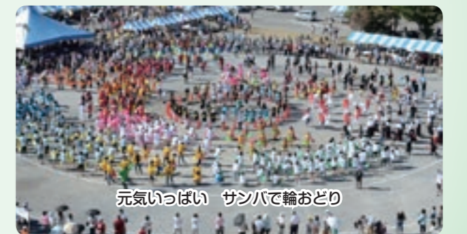
元気いっぱい サンバで輪おどり

ある場面で今年の夏を漢字一文字でと問われたとき、私は「援」と答えました。「援」とは応援、支援、声援などの言葉につながります。今後とも、さまざまな機会を通じて「援」の輪が広がり、地域が、習志野が、元気になることを願っています。