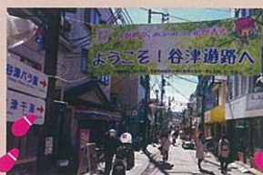
谷津遊路商店街は 美味しいものいっぱい!