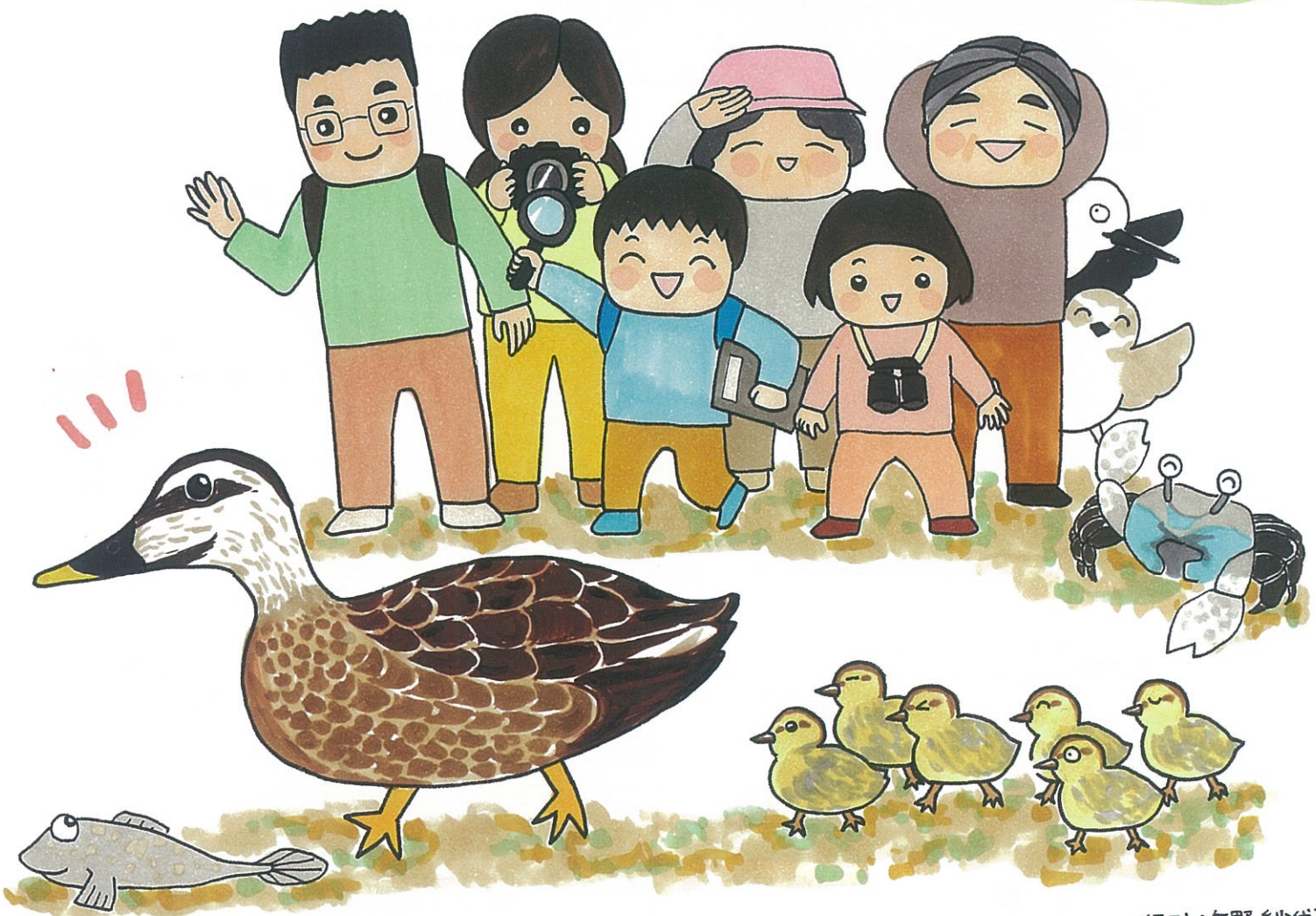
イラスト: 矢野 紗代子