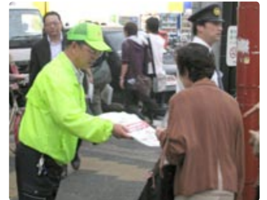
振り込め詐欺に気をつけましょう