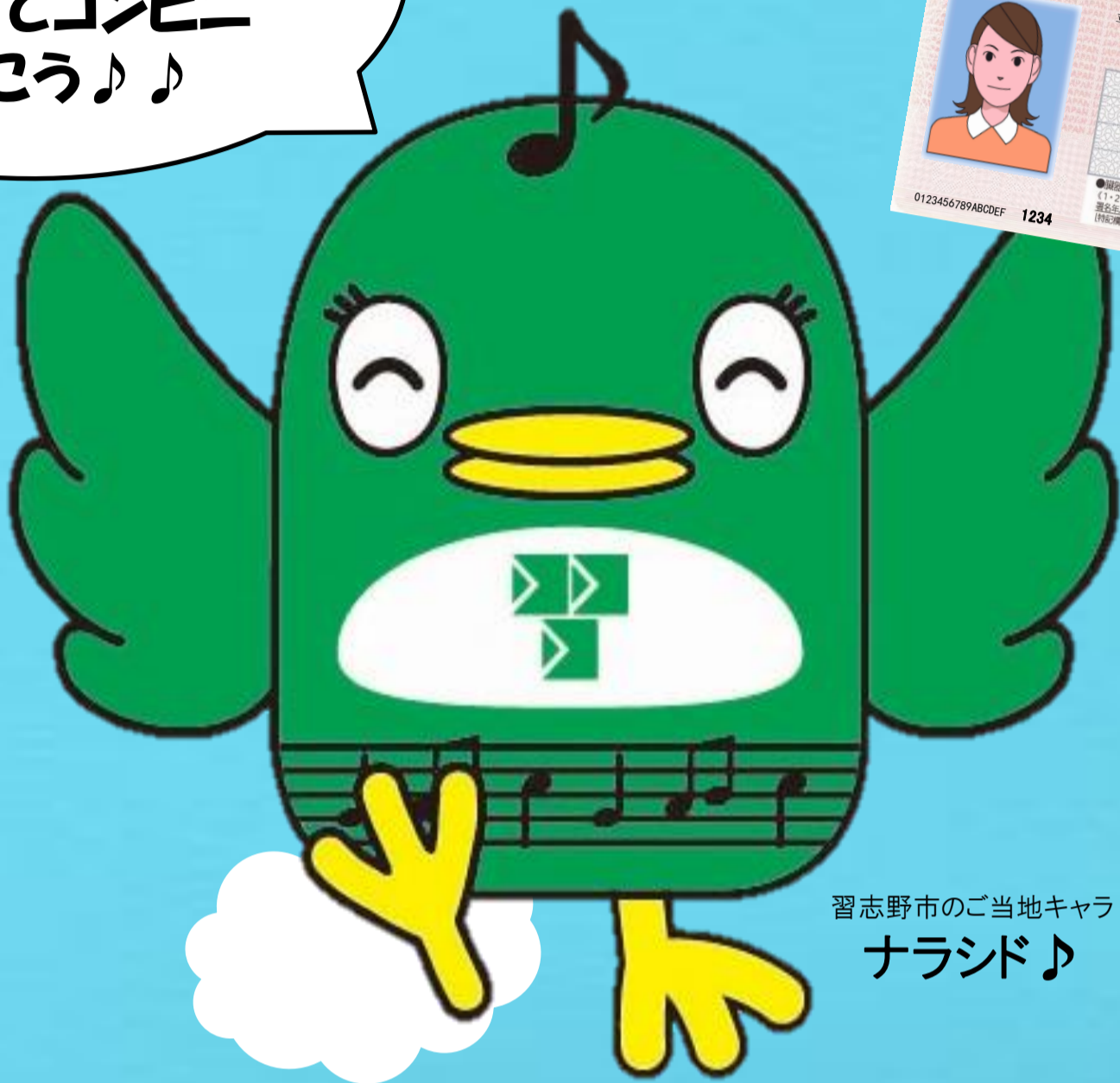
習志野市のご当地キャラ ナラシド♪