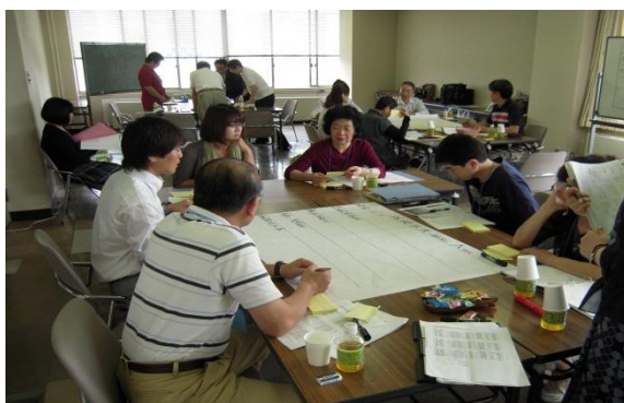
市民会議（ワークショップ）風景

市民会議では、これからの習志野市の方向性・目標を描いていくために、市民委員が主体となって進行するワークショップ（KJ法）形式で協議を行いました。各回、テーマを設定し、課題の抽出、市・市民の取り組みについて話し合い、その成果については市のホームページに逐次掲載されています。