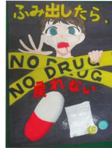
習志野警察署長賞