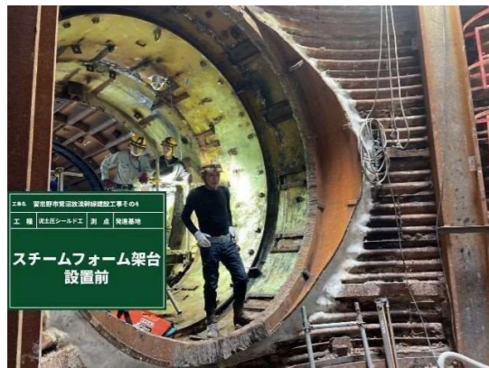
スチールフォーム組立前