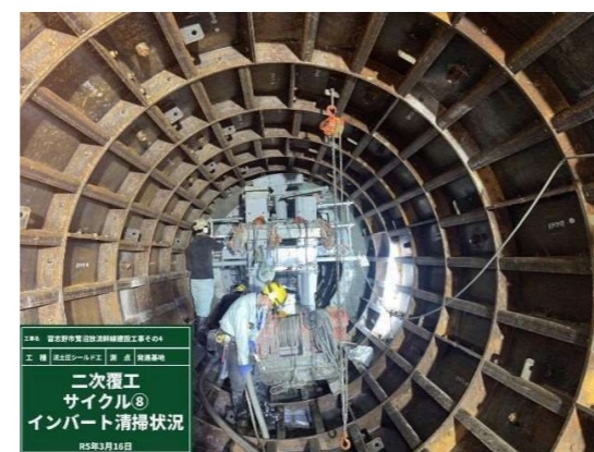
インバート清掃状況