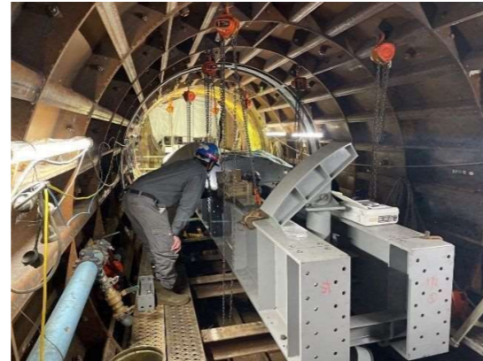
スチールフォーム組立