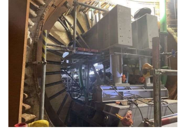
組立完了（ラップ台車側）