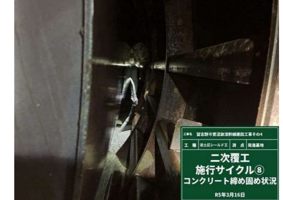
コンクリート締め固め状況