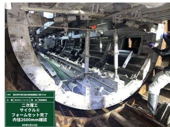
真円・セット位置確認