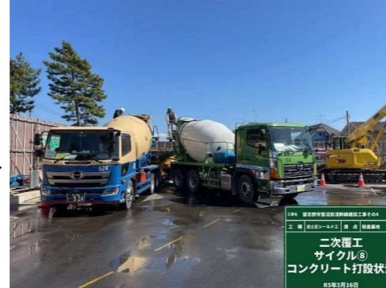
コンクリート打設（発進）