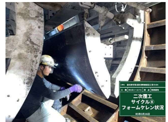
フォームケレン状況