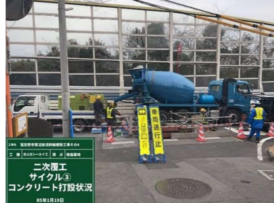
コンクリート打設（到達）