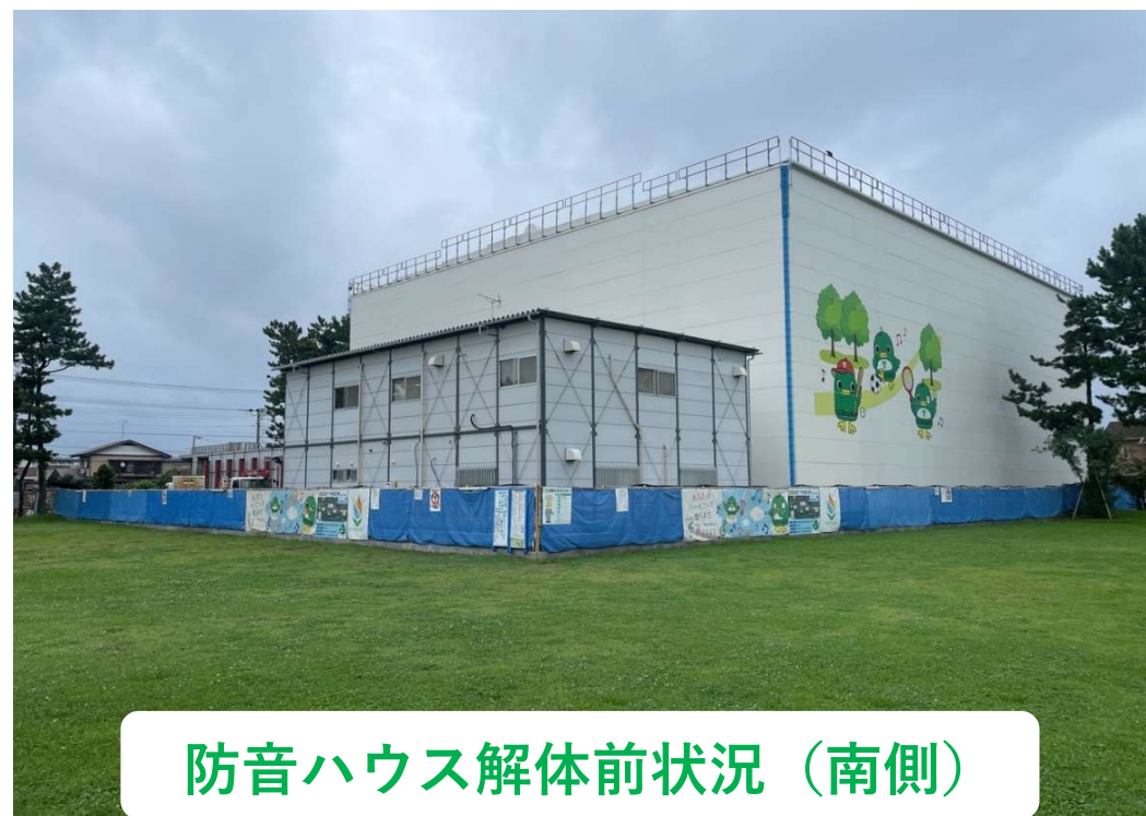
防音ハウス解体前状況（南側）