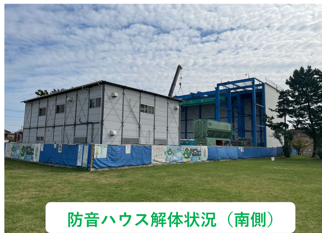
防音ハウス解体状況（南側）