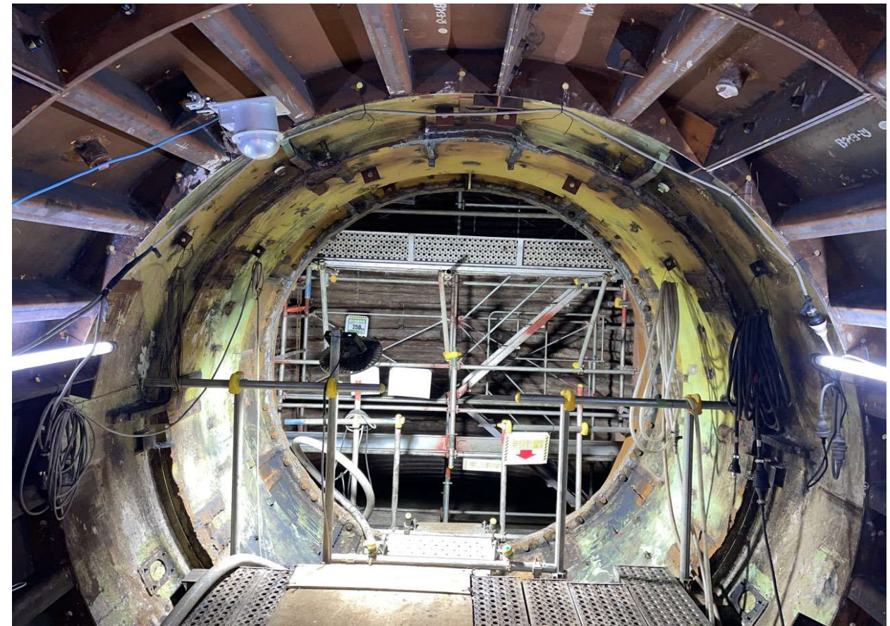
袖ヶ浦運動公園内作業状況（令和4年9月）