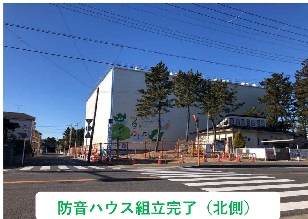
防音ハウス組立完了（北側）