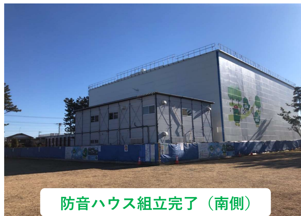
防音ハウス組立完了（南側）

引き続き、シールド仮設備 工事を実施します。 1月末より、シールド掘進工 事を開始しました。 車両搬入時には誘導員を配置 致します。 御迷惑をお掛けしますが御協 力よろしくお願い致します。