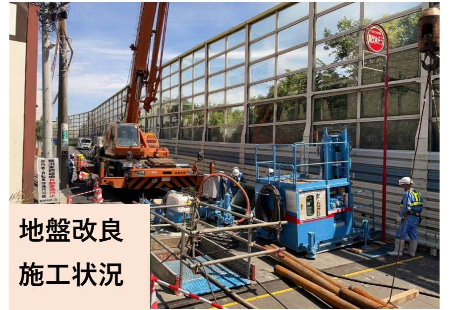
地盤改良 施工状況