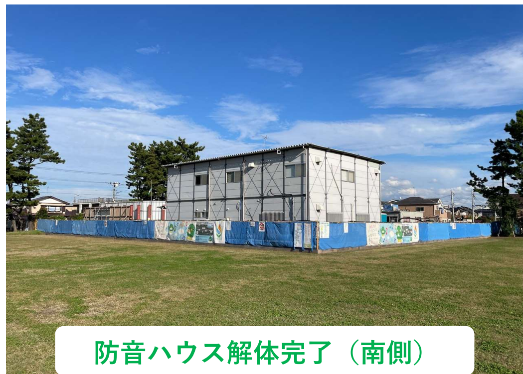
防音ハウス解体完了（南側）