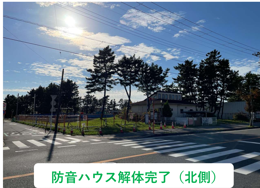
防音ハウス解体完了（北側）