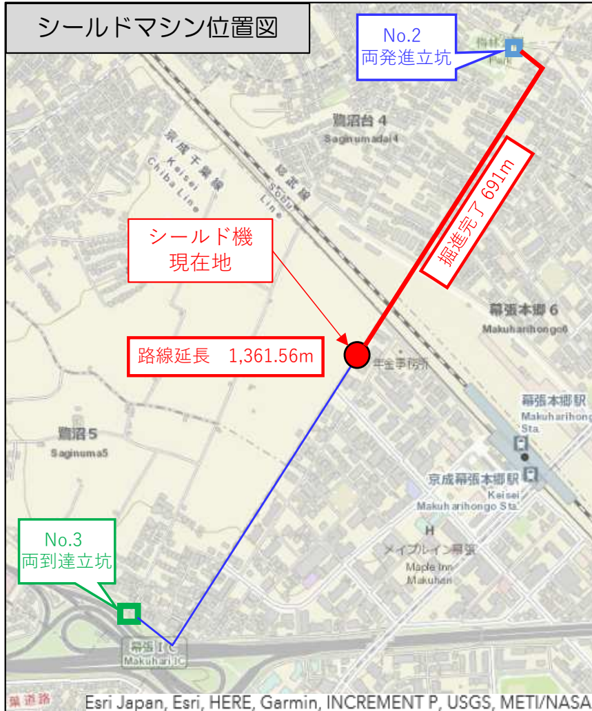
シールドマシン位置図