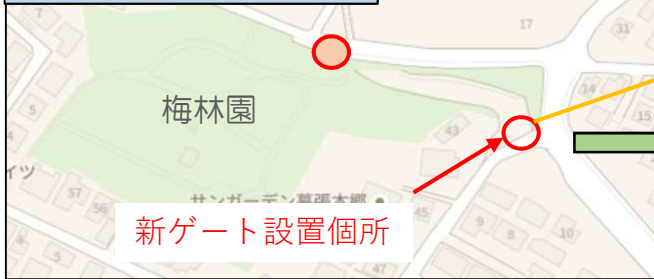
新ゲート設置箇所