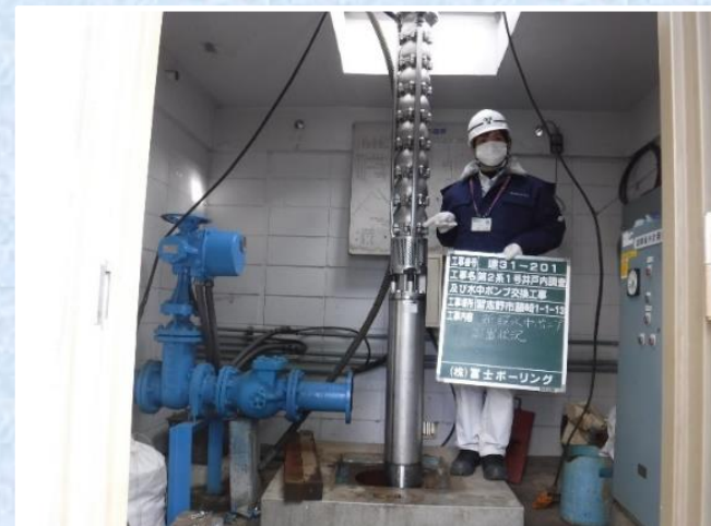
水中ポンプを交換している様子