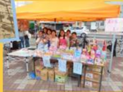
実籾マルシェで販売体験