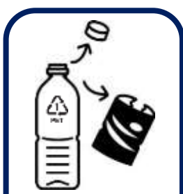
Gỡ bỏ nhãn và nắp