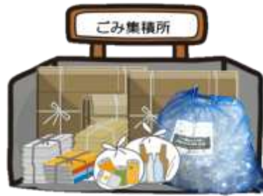
Nâng cao năng lực quản lý nơi thu gom

Có thể biết rõ cách phân loại rác ở nơi thu gom và rút ngắn thời gian thu gom. Do vậy, có thể tránh bỏ sót thu gom và bị trễ.