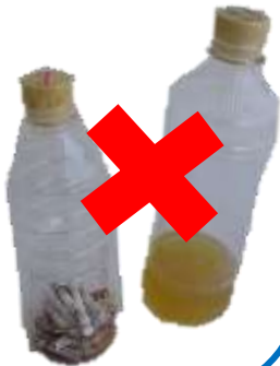
Tăng lượng được tái chế

Đồ bị bẩn như tàn thuốc lá hay đồ uống để thừa không thể được tái chế.