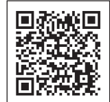
事前予約はこちらから

問合せ クリーン推進課 TEL 047(451)1793 習志野市芝園3-2-1(新習志野駅南側、県道千葉・船橋海浜線沿いの海側)