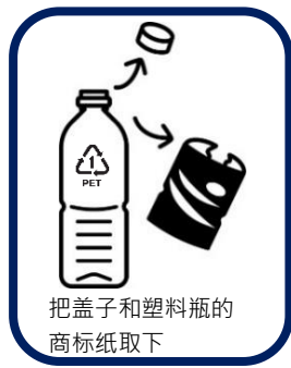
把盖子和塑料瓶的商标纸取下