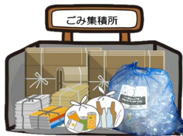
提高了收集场所的管理