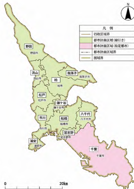
図 マスタープランの対象範囲

※千葉都市計画区域については、指定都市である千葉市が定める都市計画区域マスタープランによるものとする。