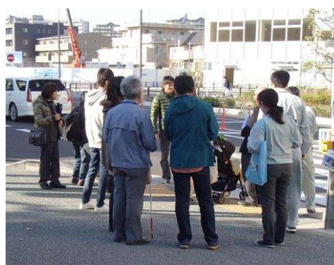
図 進捗状況の把握・評価 (バリアフリー点検)