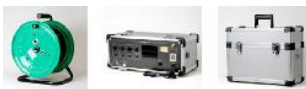
図 情報伝達・意思疎通支援の推進 (磁気ループ装置 設営イメージ)