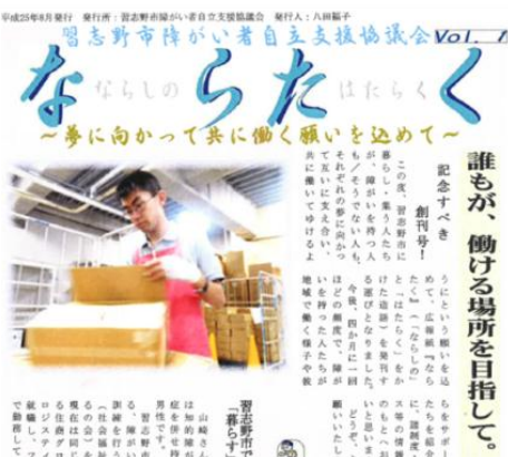
図 高齢者・障がい者等からの情報発信の促進 (習志野市障がい者地域共生協議会発行紙「ならた」)