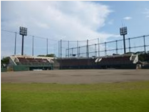
①第一カッター球場（秋津野球場）