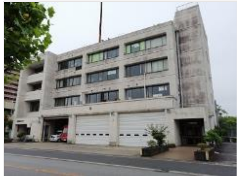
⑫中央消防署秋津出張所