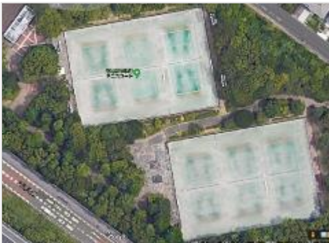
③秋津テニスコート