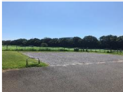
⑥秋津近隣公園予定地