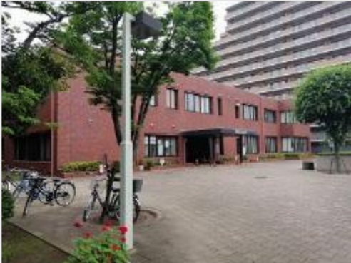
⑨⑩⑪公民館・図書館・西部支所