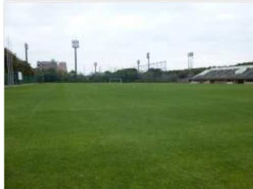
②第一カッターフィールド（秋津サッカー場）