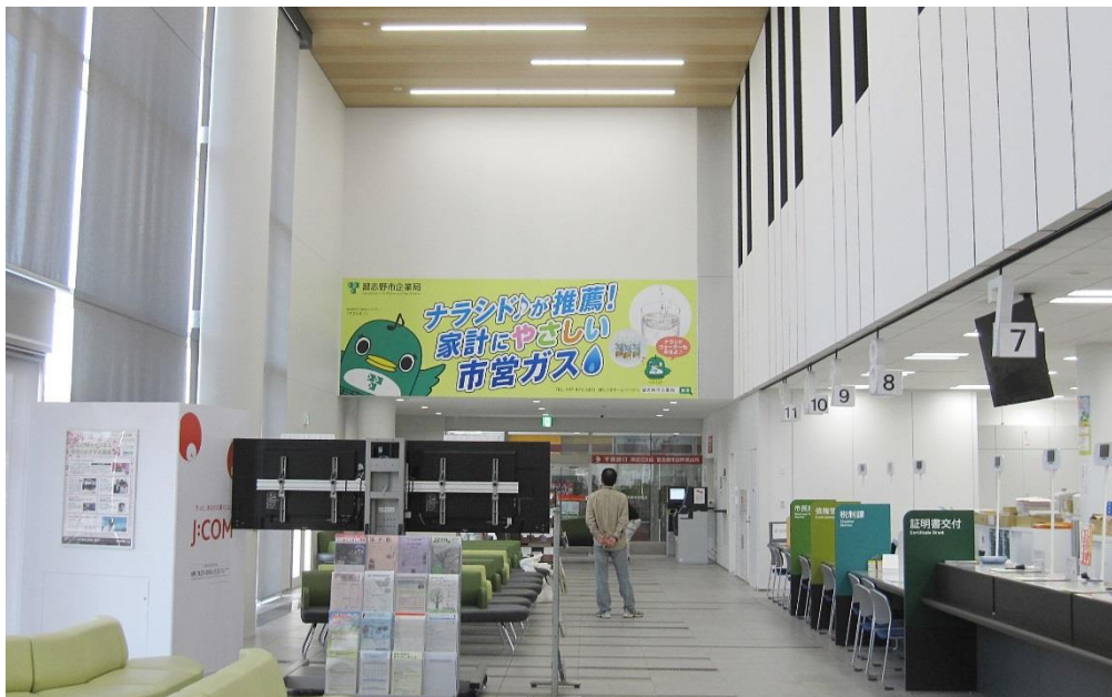
市庁舎グランドフロア ロビー壁面広告