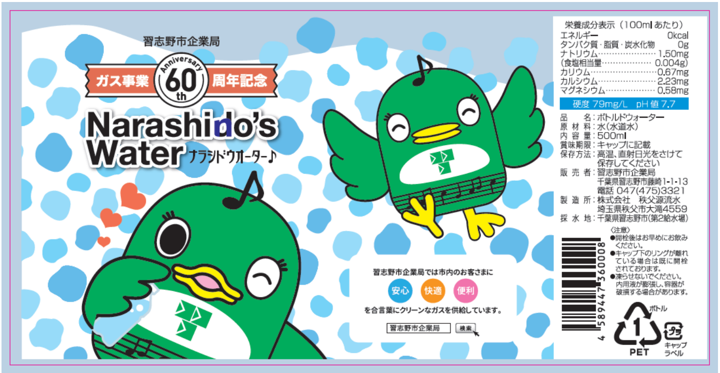
ナラシドウォーター♪ 60周年記念ボトルデザイン