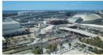
幕張メッセ Makuhari Messe