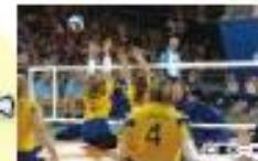
シットイングバレーボール Sitting Volleyball