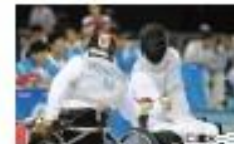
車いすフェンシング Wheelchair Fencing