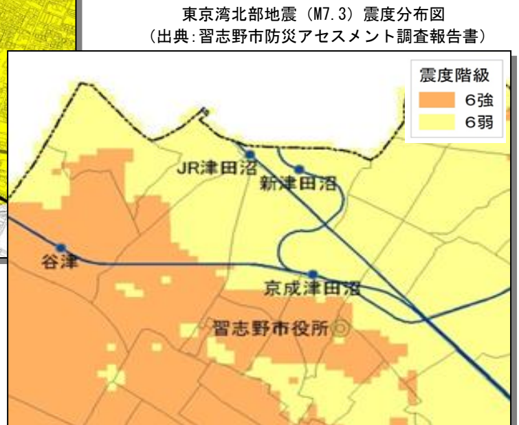
東京湾北部地震（M7.3）震度分布図