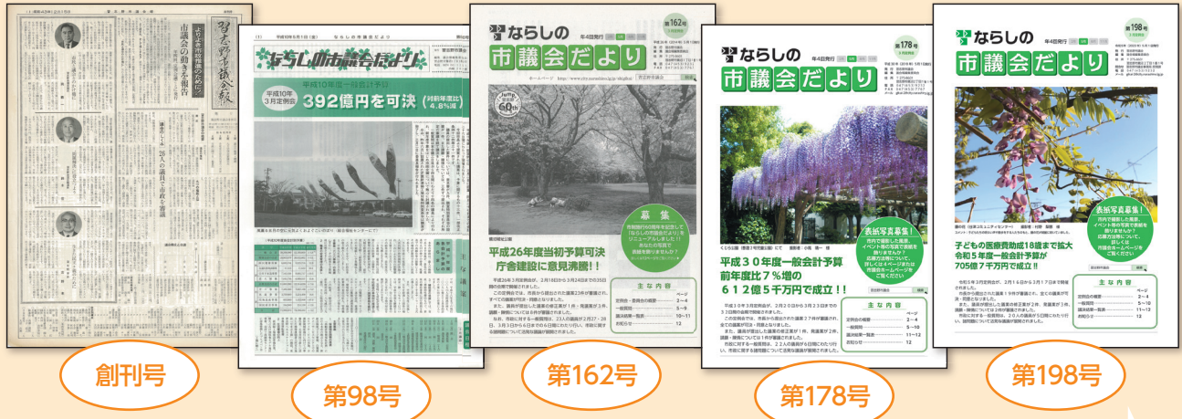
創刊号 昭和43年12月15日 「ならしの市議会だより」創刊 第98号 平成10年5月1日 2色刷りにリニューアル 第162号 平成26年5月1日 市制施行60周年を記念しA4版にリニューアル 第178号 平成30年5月1日 表紙写真がカラーに 第198号 令和5年5月1日 全ページがカラーに