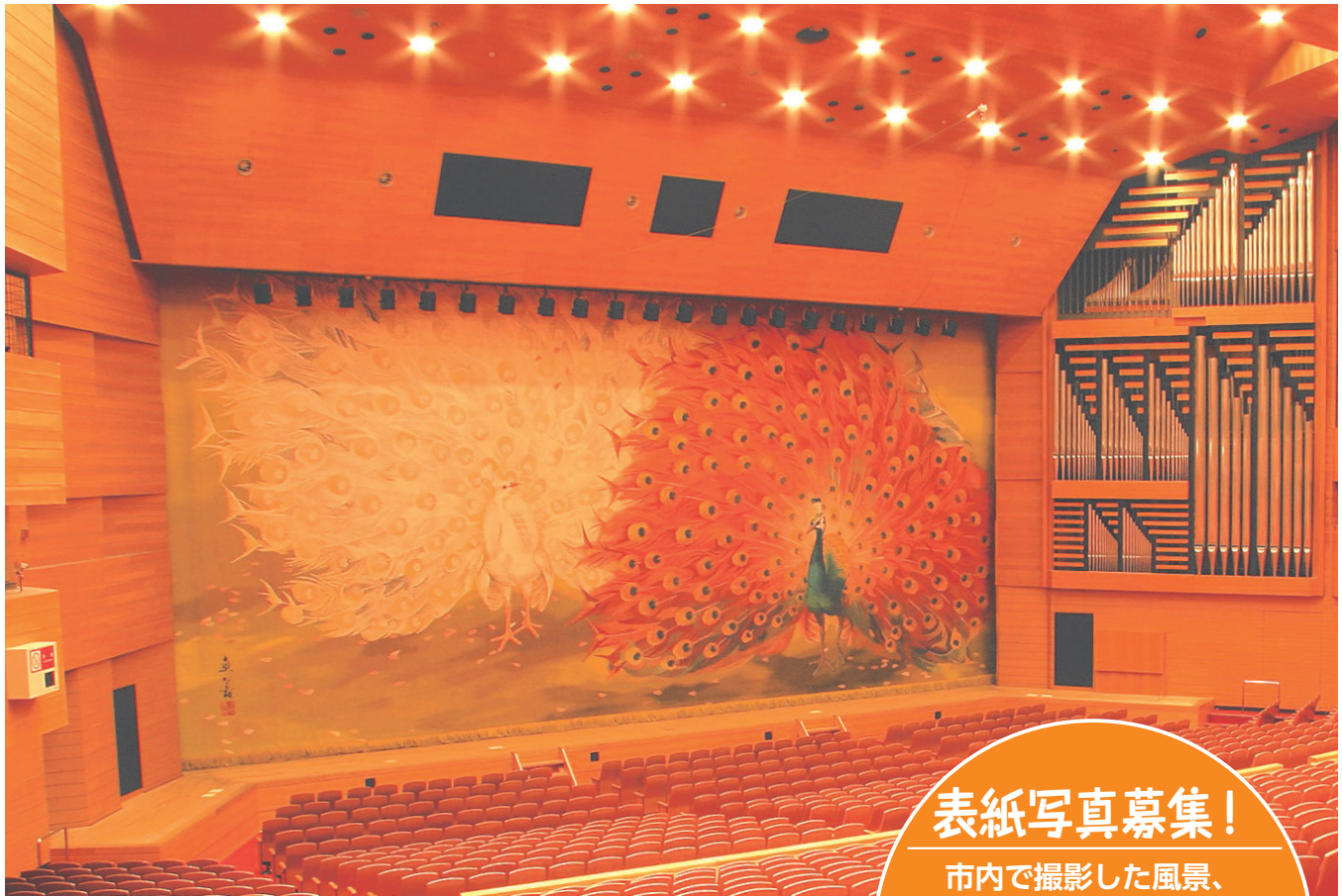
習志野文化ホール どんちよう の緞帳