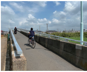
総額約40億円で補修予定の鷺沼東跨線橋

想定するのであれば、自動車の通行は非現実的。想定される通行量の予測調査を行い、費用対効果が相応であるかを検証し、市民への説明を行った上で事業決定を行うことを要望する。