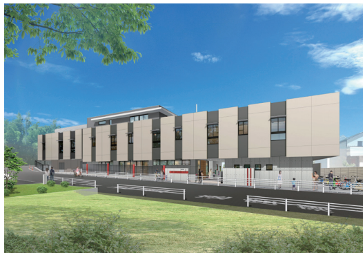
【図】（仮称）藤崎こども園の完成予想図