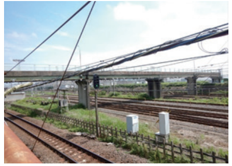
【写真】 鷺沼東跨線橋。昭和48年(1973年)架設。左は下から見た橋の状態

りますが、最近では全く手入れがされず伸び放題になっています。習志野市名木百選の中で、この松並木は「姿や形がきれいな木」として紹介されていますが、地域に住んでいる住民にとっては落ち葉の処理等で大変苦勞をしています。また、松並木が3階建てのマンションより大きくなっていることから台風などの災害時に、松の木が倒れて周辺に被害をもたらすのではないかと危惧しています。場所によっては日当たりが悪く、冬場などは午後にならないと日が当たらない状況にもなっています。 道路・公園等樹木の所有者及び管理者は習志野市です。管理の方法について地元住民との協働は必要ですが、最後は市の責任と権限において判断しなければ、市の責任放棄であると感じられます。 そこで、文教通り沿いの松並木を「姿や形がきれいな木」として剪定をお願いしたく、ここに陳情させて頂きます。別途、この趣旨に賛同す