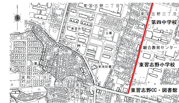
【図】 文教通りの位置 (通りは赤線で示した)

りますが、最近では全く手入れがされず伸び放題になっています。習志野市名木百選の中で、この松並木は「姿や形がきれいな木」として紹介されていますが、地域に住んでいる住民にとっては落ち葉の処理等で大変苦勞をしています。また、松並木が3階建てのマンションより大きくなっていることから台風などの災害時に、松の木が倒れて周辺に被害をもたらすのではないかと危惧しています。場所によっては日当たりが悪く、冬場などは午後にならないと日が当たらない状況にもなっています。 道路・公園等樹木の所有者及び管理者は習志野市です。管理の方法について地元住民との協働は必要ですが、最後は市の責任と権限において判断しなければ、市の責任放棄であると感じられます。 そこで、文教通り沿いの松並木を「姿や形がきれいな木」として剪定をお願いしたく、ここに陳情させて頂きます。別途、この趣旨に賛同す