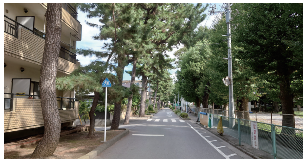
【写真】 文教通り沿いの松並木。植栽後60年以上が経過している。

後見直しに基づく同法の抜本的改正」を求める意見書について 今定例会に提出された請願の趣旨に基づき、幅広い世代の消費者被害を防止、救済するために、国に対し、次のような特定商取引法の改正を行うよう要望し、地方自治法第99条の規定により意見書を提出するものです。 1 訪問販売や電話勧誘販売について、消費者があらかじめ拒絶の意思を表明した場合には勧誘してはならない制度とすること及び事業者の登録制を導入すること。 2 SNS等のインターネットを通じてした通信販売の勧誘等につき、行政規制・クーリングオフ等を認めること、及び権利を侵害された者はSNS事業者等に対し、相手方事業者等を特定する情報の開示を請求できる制度を導入すること。 3 連鎖販売取引について、国による登録・確認等の開業規制を導入すること及び規制を強化すること。