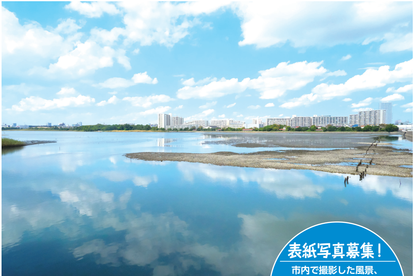
谷津干潟

コメント：昨年のコロナ禍、谷津干潟の美しさに心癒されました。 まるで習志野のウユニ塩湖のようでした。