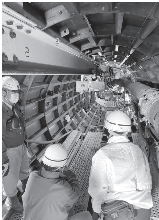
受注者の説明を受けながら 工事の進捗状況を確認

専門業務説明会は、市の専門的な業務や最新の制度について担当部署からの説明を受け、議員の理解を深めることを目的として行われております。