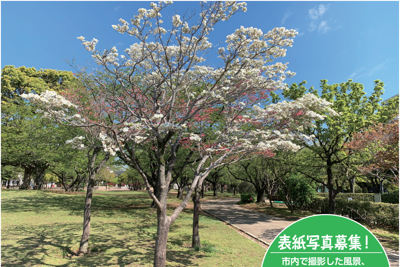
ハナミズキ(谷津公園)